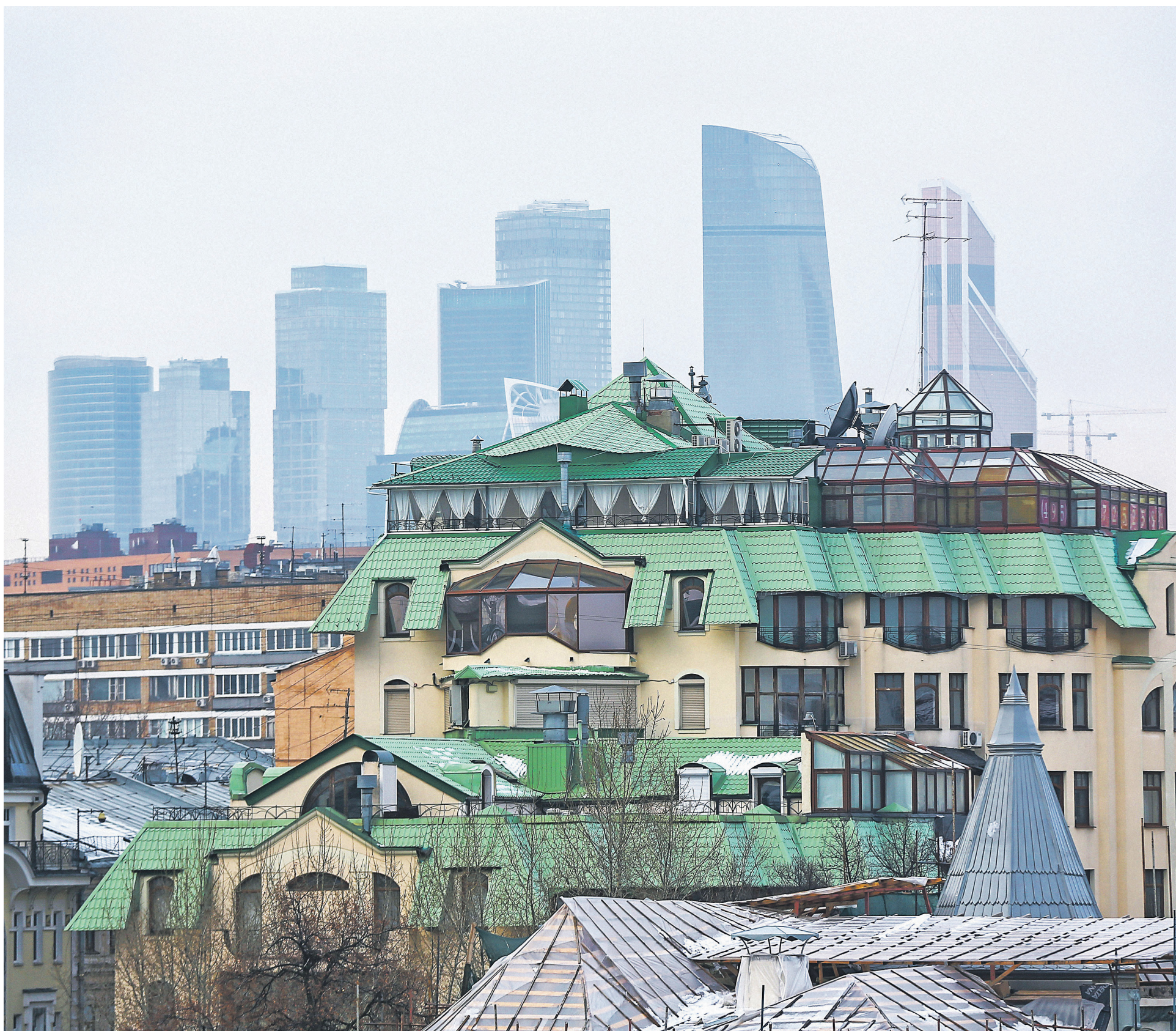
Покупатели дорогого жилья стали чаще выбирать Пресненский район, свидетельствуют данные Knight Frank: он поднялся с четвертой на вторую строку в списке самых популярных локаций. На первой — Хамовники