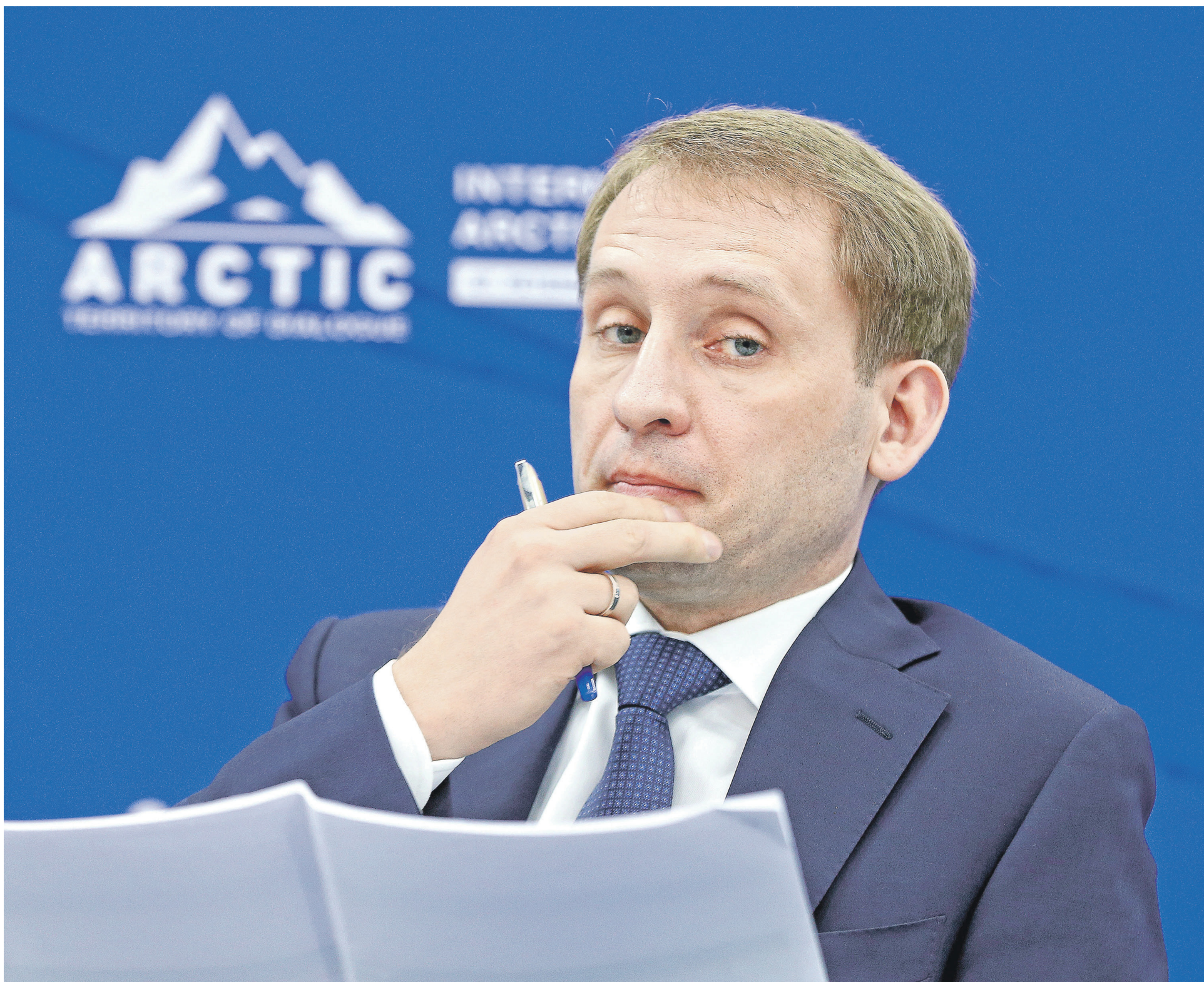
Интерес к разработке арктического шельфа в случае принятия проекта, разработанного Минвостокразвития, уже проявили крупнейшие частные игроки нефтегазового сектора: ЛУКОЙЛ, НОВАТЭК и «РуссНефть». На фото: министр по развитию Дальнего Востока и Арктики Александр Козлов

МИНВОСТОКРАЗВИТИЯ подготовило концепцию участия частных инвесторов в шельфовых проектах. → 10