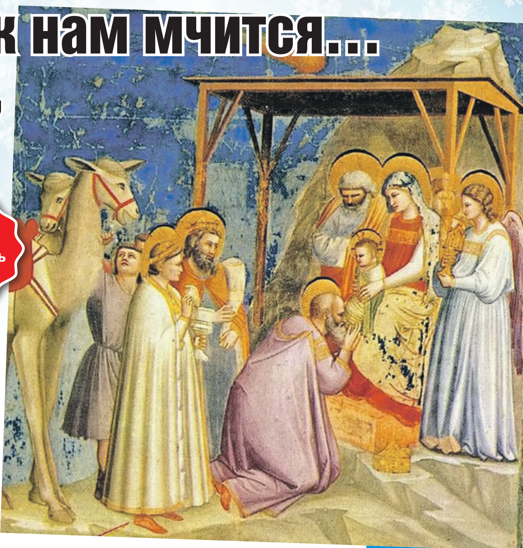
Джотто (1266 - 1337), «Поклонение волхвов»

начал проповедовать в 30-летнем возрасте и был распят незадолго до еврейской Пасхи во время правления римского императора Тиберия.