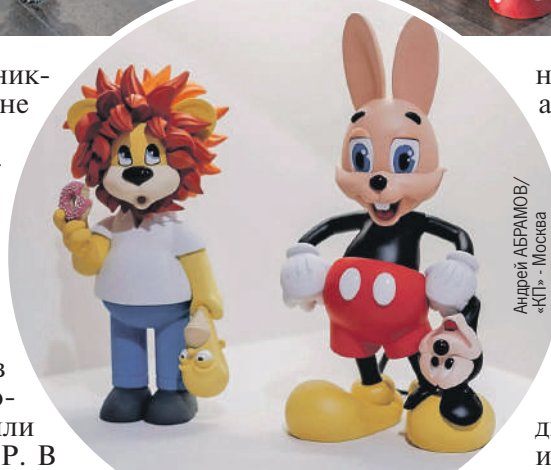
Андрей АБРАМОВ/«КП» - Москва

На руку арт-тойс сыграл еще один фактор. Подростков