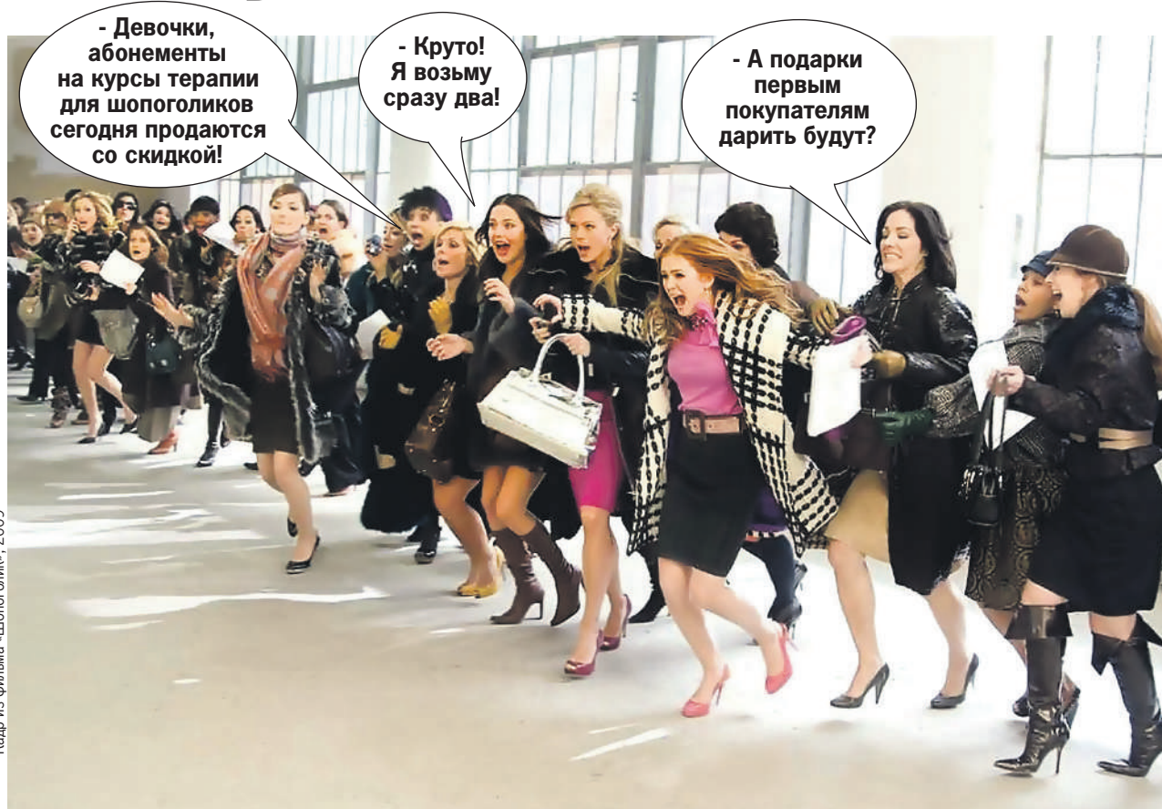
Кадр из фильма «Шопоголик», 2009

Другой вариант - группы с профессиональными психологами. На них могут собираться люди с различными зависимостями (от алкоголиков до шопоголиков и геймеров). Участники приходят на групповую терапию 1 - 2 раза в неделю. Цена одного сеанса - от 1000 до 5500 рублей. Но чтобы достичь видимого эффекта, подобные группы нужно посещать минимум полгода-год. Психотерапия - это не быстрый процесс.