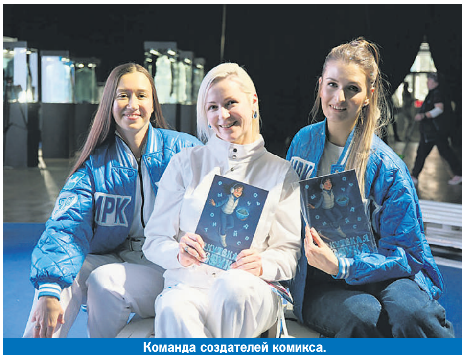
Команда создателей комикса.

Скоро о приключениях можно будет прочитать онлайн.