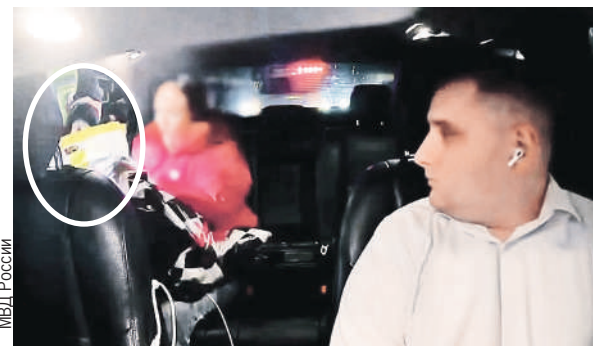
Пакет, с которым пассажирка вернулась в салон, сразу показался водителю подозрительным.