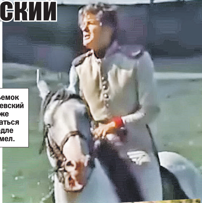
Кадр из фильма «Звезда пленительного счастья», 1975

До съемок Костолевский даже держаться в седле не умел.