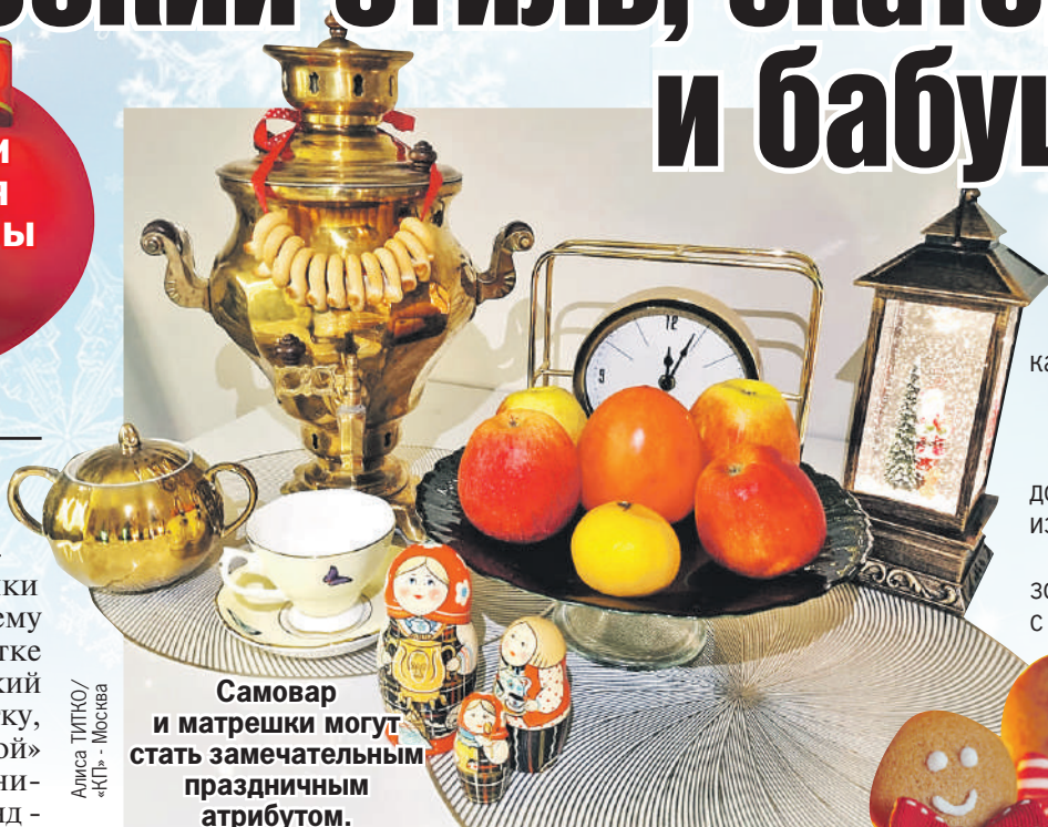
Самовар и матрешки могут стать замечательным праздничным атрибутом.

Личный опыт: Ветки и шишки достанутся вам бесплатно во время вылазки на