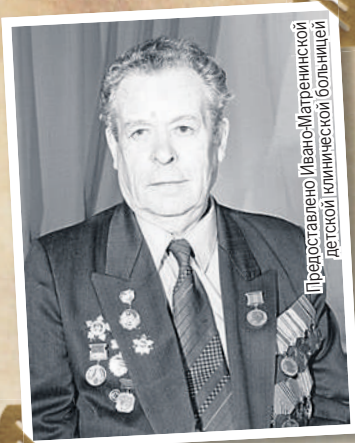
Представлено Ивано-Матренинской детской клинической больницей

Про войну Урусов рассказывать не любил. И медали одевал редко: на 9 Мая и для фотографии.