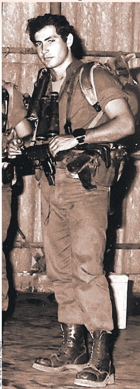
Будущий премьер в 1973 году - во времена службы в спецназе.