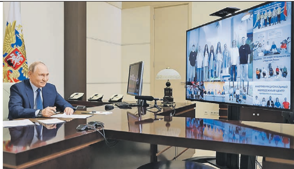
Открывая по видеосвязи пять новых молодежных центров в разных концах страны, в том числе в Новороссии, Владимир Путин интересовался, сколько получали студенты, работавшие на их строительстве.

- По результатам переговоров состоялся очередной обмен пленными. Гуманитарная составляющая имеет