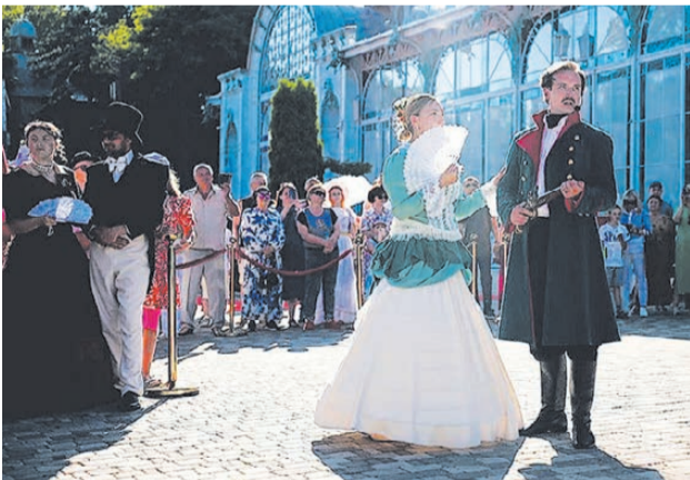
Телеграмканал главы Железноводска

Организаторы мероприятия отметили, что им удалось погрузить жителей и гостей Железноводска в атмосферу XIX века - с балами и горячими нравами.