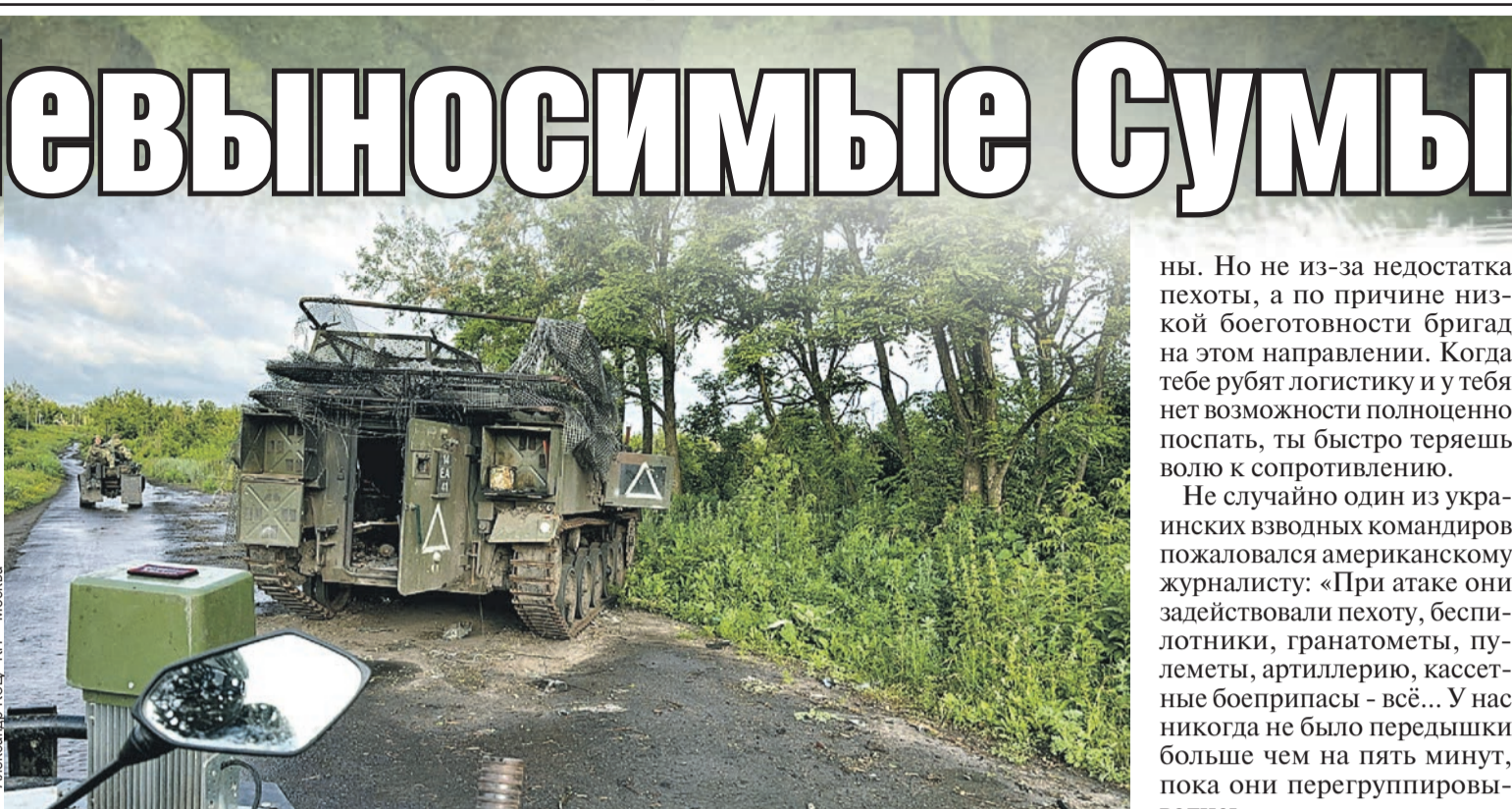
Дорога на Сумы заставлена брошенной техникой ВСУ. Как вот этот натовский бронетранспортер с треугольником на борту - знаком войск, вторгавшихся на Курщину.

Так вот в чем был смысл этого беспримерного похода! Зайти на территорию России, чтобы подготовиться к обороне на своей земле? Загадочная тактика, которая, впрочем, не принесла ожидаемых плодов. Окопы у ВСУ, пишет Wall Street Journal, если и есть, то устаревшие и не защищают от дронов. А на некоторых участках приходится рыть траншеи прямо под огнем. При этом опасные участки прорыва российских войск даже не были заминированы.