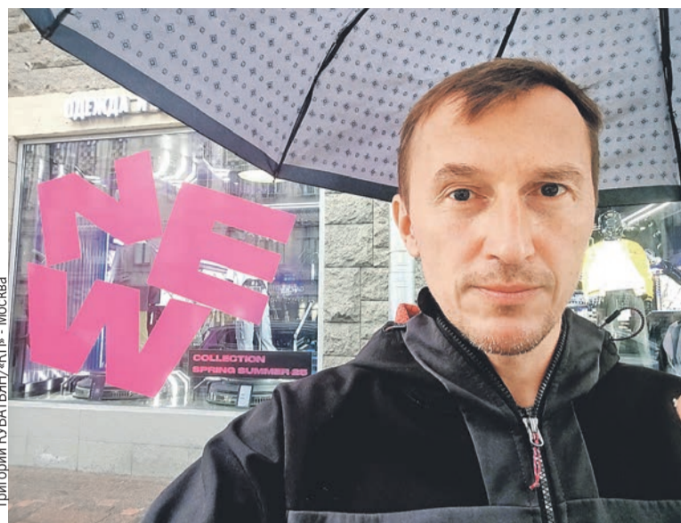
Гуляя по центру Петербурга, я засомневался: то ли дождь идет, то ли это уже rain капает на мой umbrella...

ляется администратор. - К нам в основном приходят обедать. Нельзя же назвать столовую «Обеденное время»! Хотелось как-то оригинальнее.