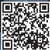
Фото присылайте в «Комсомольскую правду», e-mail: miss@kp.ru

Голосуйте за понравившуюся вам участницу на нашем сайте KPRU в разделе «Будь стильной с «КП»!»