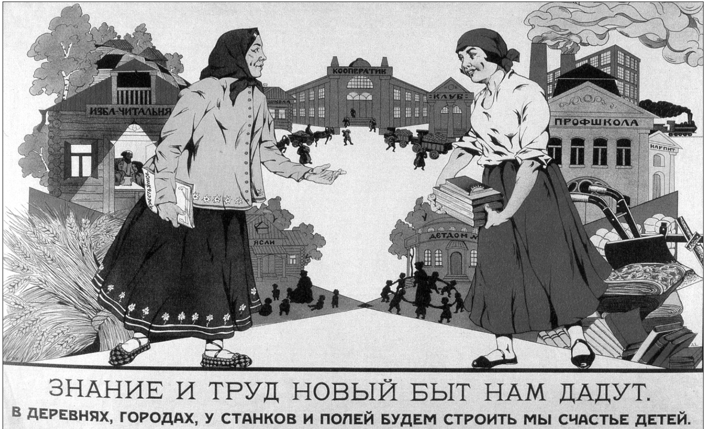
Художник Л. Емельянов. 1924 г.