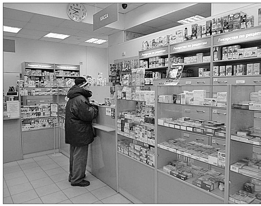
рассказывать сказки про «социальное государство».

Налицо критическая зависимость. Но кого это волнует, если каждый чиновник, от муниципального до федерального, озабочен лишь тем, чтобы, пока он при должности, набить свои карманы бюджетными деньгами так, дабы обеспечить себя, своих детей и внуков, а потом, как они говорят, «свалить из раишки» за кордон. Проверьте семью любого чиновника на расходы — они будут значительно превышать их официальные зарплаты. В нынешней России есть баре, есть холопы. А народу продолжают