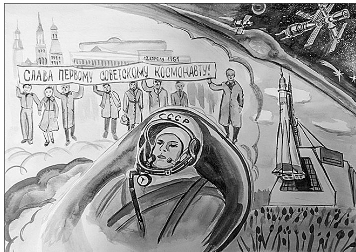
Одна из работ, представленных на конкурс.

держание: дети прониклись чувством уважения и любви к своей Родине.