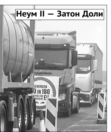
Неум II — Затон Доли

Гнев вызвал ключевой мо-мент концепции урезания трат, касающийся деятельности за-рубежных корреспондентов в 150 государствах. Администрация сочла предоставление им льгот нецелесообразным и че-резмерно дорогостоящим. Сей-час около 270 хроникёров получают определённые дота-ции, в том числе на жильё, пе-реезд и обучение детей, что об-ходится агентству примерно в 16,7 млн евро в год. Однако вскоре большинство загранич-ных сотрудников перейдут в статус местных журналистов, при этом в некоторых странах им будет повышено жалование в соответствии с тамошними законами об оплате труда.