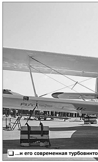
...и его современная турбовинтовая версия — китайский Y-5BG.

Все мы помним фразу из советского киношедевра «В бой идут