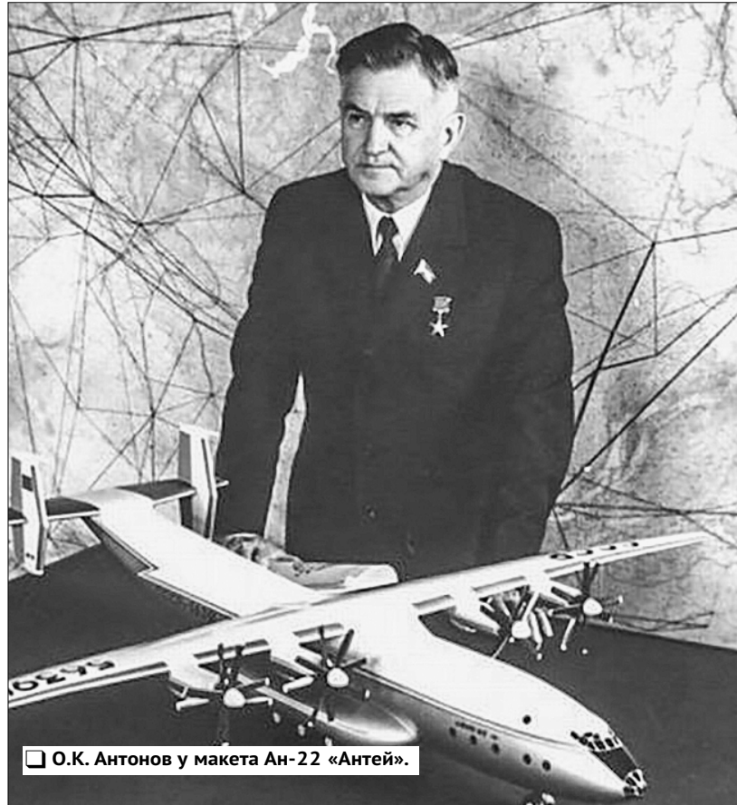
О.К. Антонов у макета Ан-22 «Антей».

пор держится на машинах, руку к разработке которых приложил ещё лично знаменитый советский авиаконструктор О.К. Антонов, Герой Социалистического Труда, лауреат Ленинской и Сталинской премий. Для своего времени его самолёты стали передовыми, а в плане долговечности и надёжности продолжают задавать самые высокие стандарты и сегодня.