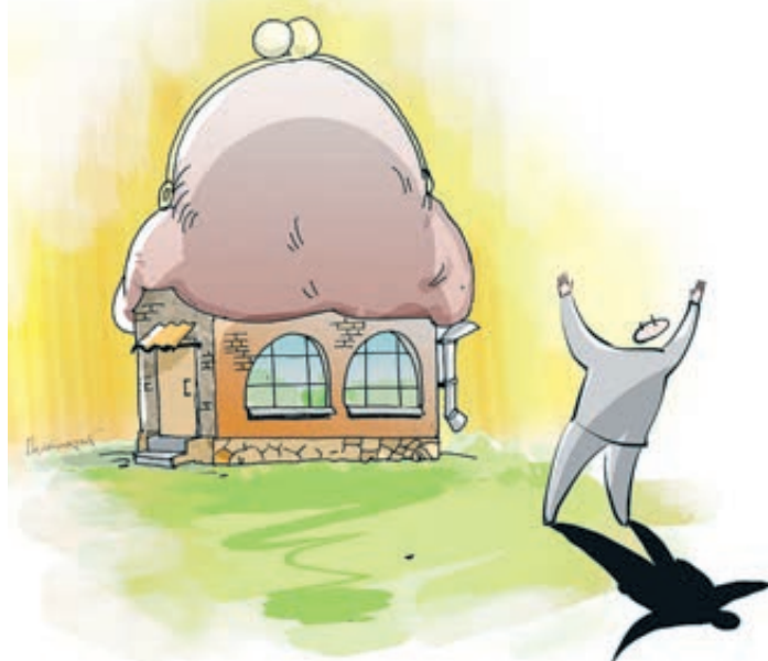
ИЛЛЮСТРАЦИЯ ВИТАЛИЯ ПОВИДИЧЕВОГО/САЙТОВЫВАНК. RU

Оказалось, с точки зрения эффективности вложения денег дорогие квартиры в престижных районах мегаполисов совер-